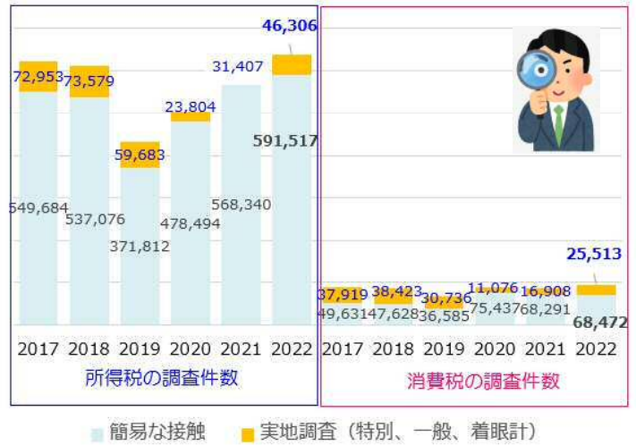
調査件数全体ではコロナ前を超える水準へ

1件当たりの追徴税額は所得税21万円、個人事業者の消費税42万円と、こちらも増加に。