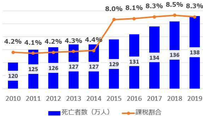
相続税の課税割合と死亡者数の推移

相続税の課税割合（申告書提出＋納税あり）は全国平均で8.3%と前年（8.5%）より0.2%下落。課税割合は2015年の相続税増税以来上昇が続いており、今回初めての下落となりました。